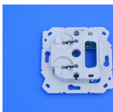
Module de base 125.0100